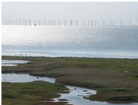
Sången skrevs i Bunkeflostrand