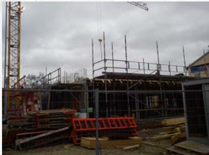
Bygget i februari

Premiären för hotellet beräknas till november 2011. Namnet på hotellet är inte klubbat ännu, men vi lovar att återkomma inom kort.